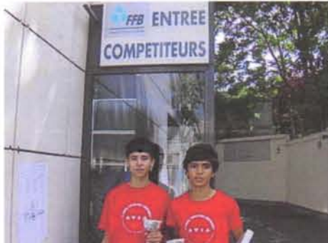
... et sortie des vice-champions.