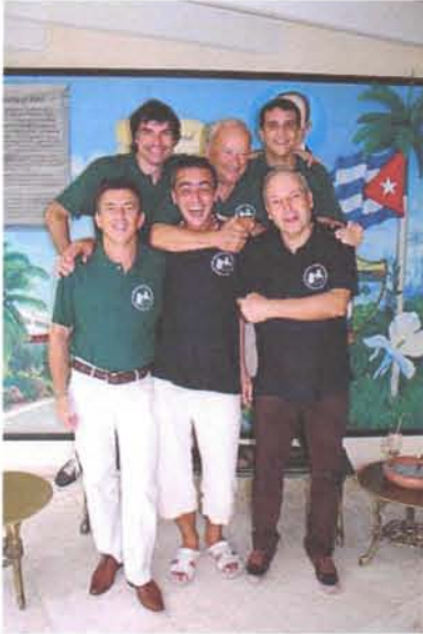
Les Guadeloupéens en route vers Eindhoven.