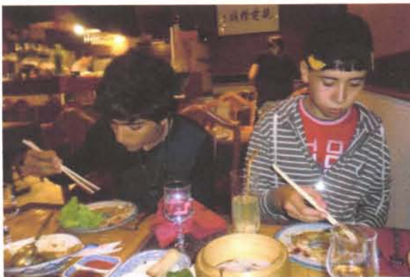
Après le maniement des cartes, celui des baguettes : moins facile ?